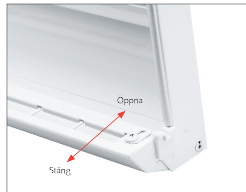
Spjället regleras enkelt med fingertopparna. Bilden visar spjället i öppet läge

Easy-Vent kan vid behov torkas av med lätt fuktad trasa. Förutom regelbundna filterbyten krävs normalt ingen ytterligare rengöring. I undantagsfall kan fasadgaller, kanal och donets insida rengöras med flexibel rensslang ansluten till dammsugare.