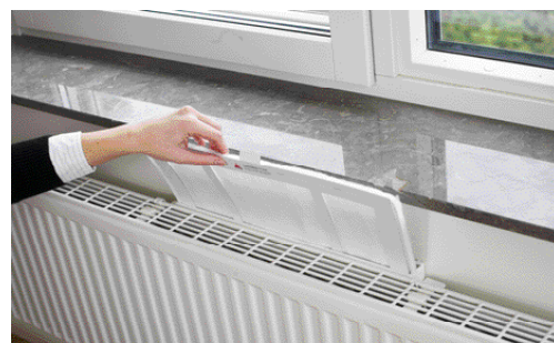
Att byta filter är enkelt eftersom filtret är böjbart

(*) På äldre Easy-Vent modeller har inte filterluckan någon låsfunktion, utan läggs bara på plats över filteröppningen.